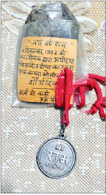
सोनीपत। 1992 में अयोध्या से लाया गया विवादित ढांचे का टुकड़ा व श्रीराम नाम का पदक।