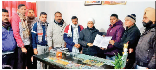
कुरुक्षेत्र। ज्ञापन सौंपते कर्मचारी।