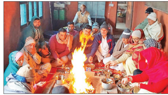
गोहाना। हवन में मंत्रोच्चारण के साथ आहुतियां डालते हुए नागरिक।