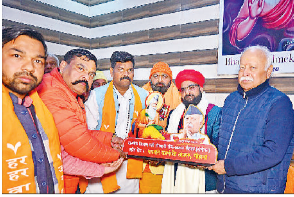
गोहाणा। डॉ. मोहन भागवत को स्मृति चिह्न भेंट करता संत समाज।