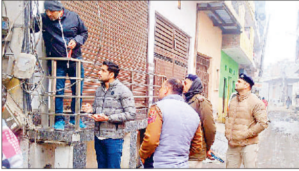
खरखौदा। बिजली मीटरों की जांच करते अधिकारी।