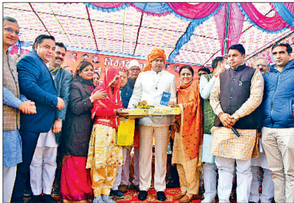
गोहाना। प्रदेश प्रभारी बिप्लव देव लाभार्थियों को गैस चूल्हे भेंट करते हुए।

■ भाजपा के प्रदेश प्रभारी ने अयोध्या में राम मंदिर में दर्शनों का निमंत्रण दिया ■ मुख्यमंत्री मनोहर लाल विदेश जाने के इच्छुक 10 हजार युवाओं को प्रशिक्षण देकर रोजगार के लिए इजरायल भेजेंगे