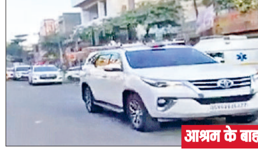
आश्रम के बाहर तैनात जवान

22 जनवरी को अयोध्या में भगवान श्री राम के मंदिर का प्राण प्रतिष्ठा समारोह आयोजित होगा। इसी को लेकर आरएसएस सरसंघचालक मोहन भागवत